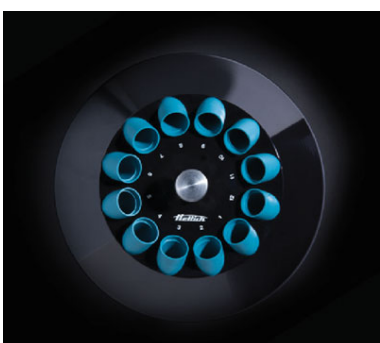
Арт. 1139. 12-местный угловой ротор