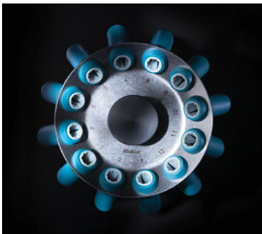
Арт. 1133. 12-местный угловой ротор